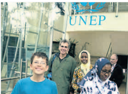
In Nairobi besuchte Felix den Chef der UNEP, dem Umweltprogramm der Vereinten Nationen