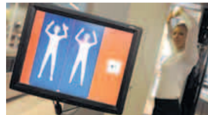
Eine Frau am Körperscanner im Hamburger Flughafen

Körperscanner sollten das Fliegen sicherer machen. Am Hamburger Flughafen wurden die Passagiere in den vergangenen Monaten durchleuchtet, um die Geräte zu testen. Im Gegensatz zu den bisher verwendeten Kontrollgeräten reagieren Körperscanner auch auf nicht-metalli-