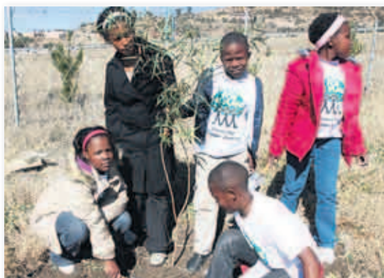
Erste Bäumchen: Die Kinder in Lesotho sollen nun Setzlinge von ihrer Regierung bekommen

Felix hatte vier Wochen lang ein volles Programm, er hat mit Kindern, Politikern und Hoheiten gesprochen. Zu sehen, wie der Klimawandel die Welt verändert, war manchmal für ihn. Die Unterstützung jedoch, die die Menschen Felix zusicherten, sei eine wahre Freude gewesen. „Ganz toll war es, als wir im südafrikanischen Königreich Lesotho die Prinzessin und die Königin trafen“, erzählt er. Die Begegnungen in Afrika haben Felix noch mehr von seiner Sache überzeugt: „Wenn wir Kinder weltweit zusammenarbeiten, können wir viel verändern.“ Alina Stöver