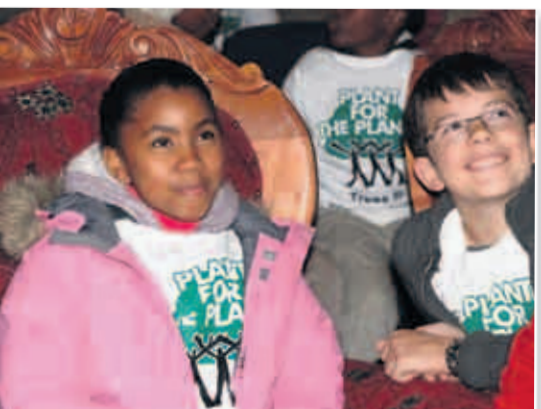
Auch Prinzessin Senate und ihre Mutter, die Königin von Lesotho (gr. Foto), machen mit