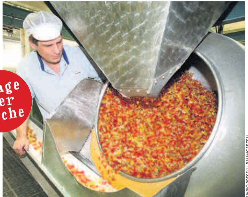
In der großen Trommel werden die Bärchen mit Bienenwachs behandelt

Ein Fließband transportiert dann flache Kästen heran, die mit Stärkepulver gefüllt sind. Ein Brett, auf dem etwa 500 Gummibärchenfiguren aus Gips angebracht sind, presst die Figuren nach oben in die Stärke. Zurück bleiben die Abdrücke: Hohlformen, die über Düsen mit der